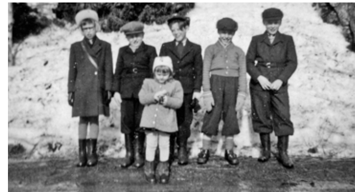
Ett gäng busungar vid postlådan.