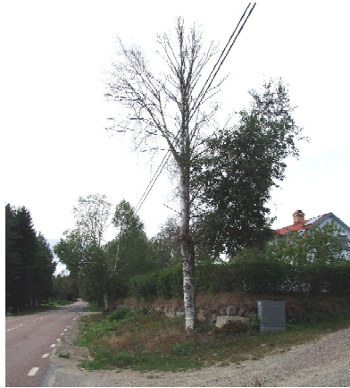
Den torra björken