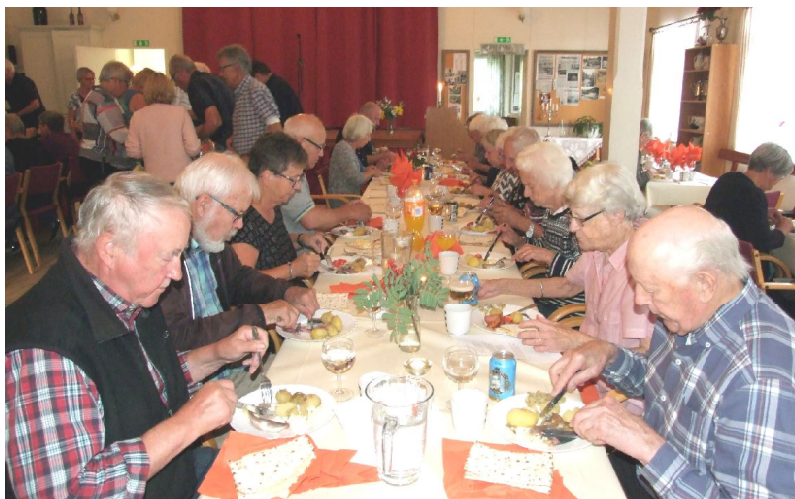
Här syns några som njuter av ”fermenterad fisk” i Byalagets regi den 31/8

Konserveringsmetoden med den långa hållbarheten är en förklaring till att surströmmingen tillsammans med ärtsoppan blev klassisk mat inom det militära. Fet fisk som lax, öring, mört, karp, röding, haj och rocka, är andra exempel på fisk som runt om i världen har konserverats, eller lokalt fortfarande konserveras på detta sätt. Det som idag kallas gravad lax var nog också ursprungligen en mer surströmmingsliknande rätt. I Norge kallas fisk som konserverats genom fermentering rakfisk (från fornnordiskans raker – blöt) och i norska källor förekommer denna benämning så tidigt som 1348.”