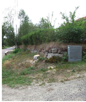
och ett par timmar senare