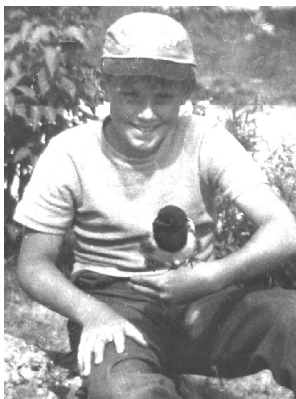
Jag med tam skata 1956.

Pang! Laddningen detonerade i ett rökmoln, och den stora stenen sprack som planerat i flera mindre delar. Och rakt upp i luften som en projektil flög skatan! Ner kom den också på nästan samma ställe. Men då var den ”naken”! Allt dun och alla mindre fjädrar var borta. Bara stjärtfjädrarna och de grövsta vingpennorna satt kvar, men mycket uppfransade och tilltufsade. Alltså i ett skick som inte möjliggjorde flygning.