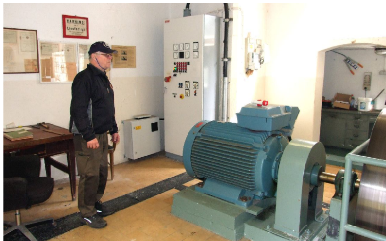
Nisse i Milsbrons kraftverk, vid den imponerande generatorm...

Från de allra första ”vattenhjulen” som vid våra vattenfall av vattnets kraft roterade och på olika mekaniska sätt överförde rotationen till arbetande maskiner (sågar, kvarnar, mm) och till dagens moderna generatorer finns förstås en lång historia av utveckling. Elektriciteten var naturligtvis ett jättekliv, när det gäller kraftöverföring generellt. I stället för att i närheten av vattendragen via stånggångar och remskivor överföra den mekaniska energin till maskinerna, kunde man nu via kablar enkelt överföra energin på långa avstånd och utan komplicerade mekaniska anordningar som hela tiden måste smörjas och underhållas. Det innebar att man inte längre behövde ha industrierna intill vattendragen, utan kunde förlägga dessa där det var praktiskt av andra skäl.