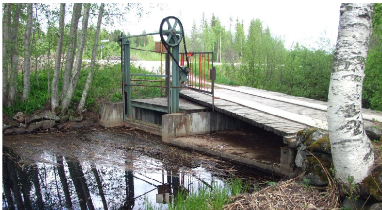
Fördämningen som reglerar vattenståndet i Grängsjön och mängden vatten som släpps ner i Baståsån, mot Gränsejön och Svedbro...

Som alla vet, så är vatten nödvändigt för allt högre liv på vår planet. Det är ju till och med så, att vi själva huvudsakligen består av vatten. Uppemot 70 procent eller mer av människokroppen består just av denna magiska och livsnödvändiga vätska (men hjärnan består mest av fett!).