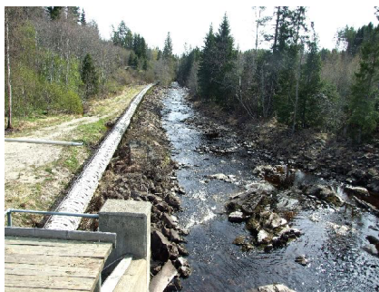
Den nästan 240 m långa tuben från dammen vid Milsbron och ner till kraftverket

längre sträcka föll åtskilliga meter. Under en period var Svedbro en riktig "industriort". Men - som sagt - elektricitetens möjligheter att enkelt överföra energi långa vägar från vattenfallen kom på sikt att helt förändra industriernas lokalisering i landet.