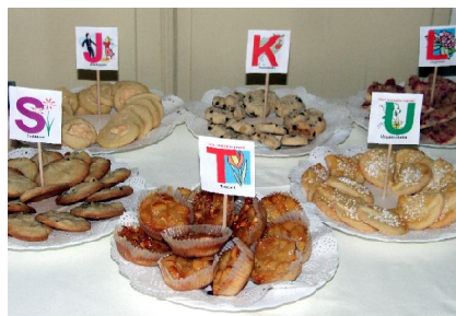
Bild från förra årets kakbuffé

Kristi himmelfärds dag, den 29 maj inleder vi med traditionell gökotta på berget nordost kapellet kl. 07.00.