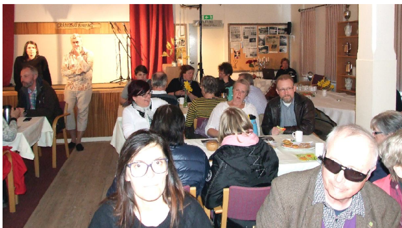
Kapellets stora sal hade fått "cafémöblering", och skådespelarna rörde sig runt i lokalen. Vid ett bord satt kände författaren och radioprataren Tappas Fogelberg - till höger i bild.