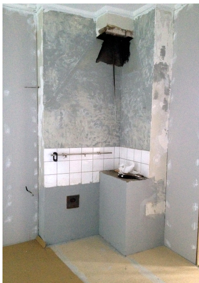
Här stod den gamla järnspisen. Nu är både den och den stora kåpan över borta.

Arbetet med köket har fortsatt under sommaren, och köket har nu ett golv som är stabilt, plant och vågrätt. Åtskilliga mantimmar har lagts ner under sommaren. Men fler går åt! Återstår bl.a. målning, mattläggning, kakling och montering av inredning. Alla tisdagskvällar fram till den 15/9 kommer att behöva användas till detta. Önskvärt och nödvändigt med fler arbetsvilliga dessa kvällar! Närmast alltså den 14, 21 och 28 augusti, samt även torsdag den 16 denna månad. Sistnämnda datum skall även golv-matta läggas i köket. Den 21 och 28 sker uppsättning av kakel, montering av köksinredning och VVS.