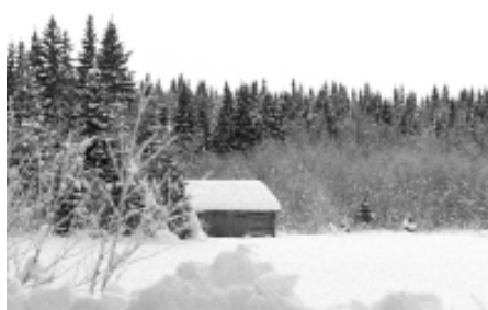
Samma lada den 31 december 1967