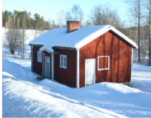
Bastun i Svedbro den 26/2 i år.

(den ursprungliga texten skriven av Bengt Nordlund och ställd till redaktionens förfogande av Ingrid Nordlinder, - med författarens godkännande)