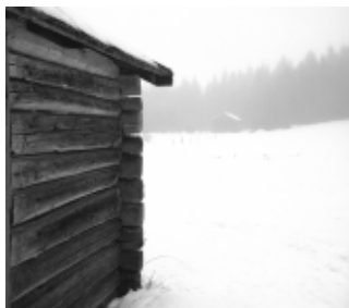
David's lada den 28 december 1960